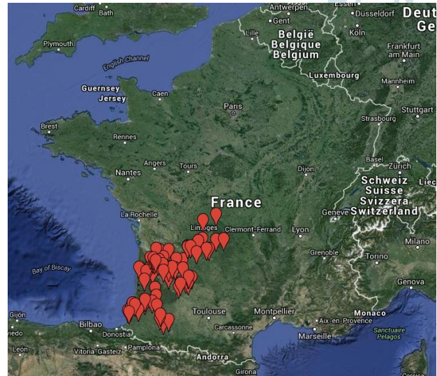
Répartition géographique des investigateurs SAGA au 23 octobre 2015

Aidez-nous à augmenter le nombre d'investigateurs!